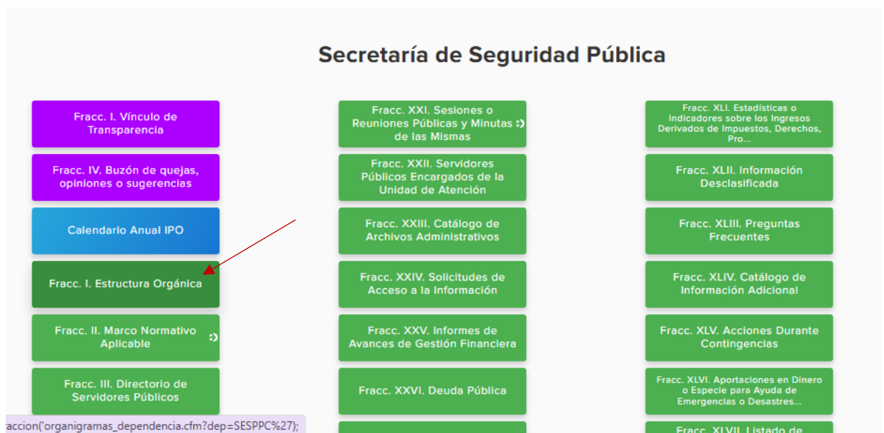
Imagen número 1: